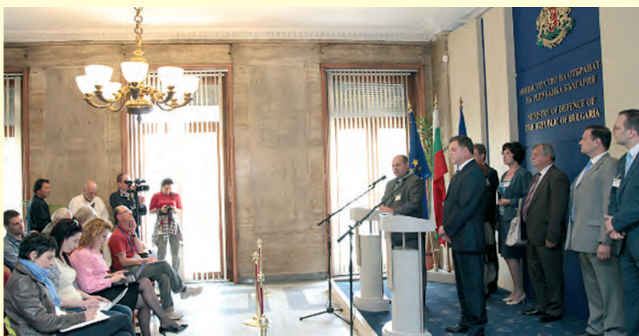
Пресконференция по повод подписването на споразумение за предаване на архивните дела от Служба „Военна информация“ на Комисията Press conference on the signing of agreement for transfer of archives from the Military Information Service to the Committee

negatives and remaining reference material. Following the order of the Minister of Defense Nikolay Nenchev dated 27 May 2015, an agreement regulating the process of transmission of about 33,000 archive files from the Military Information Service to the Centralized archive of the Committee for preservation was signed.