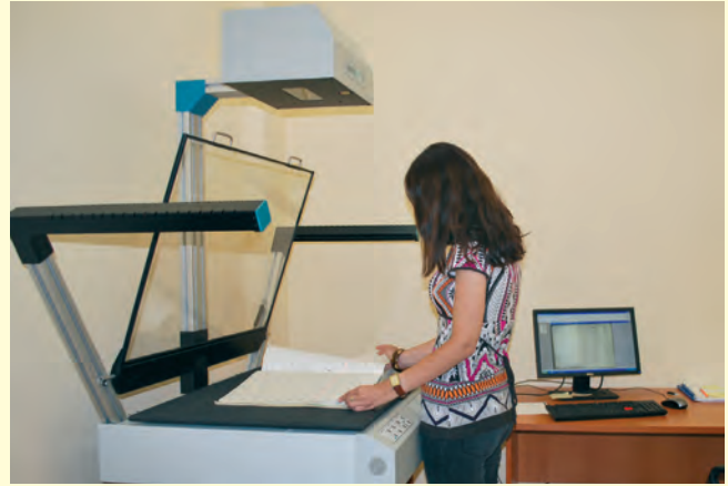
Дигитализация на документи Digitalization of documents