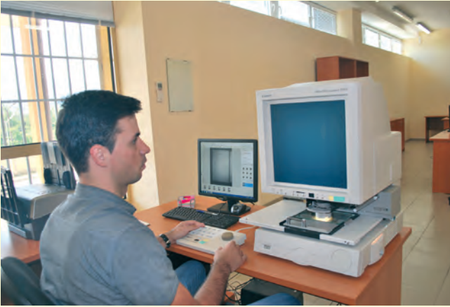
Обработка на микрофилми Processing of microfilms