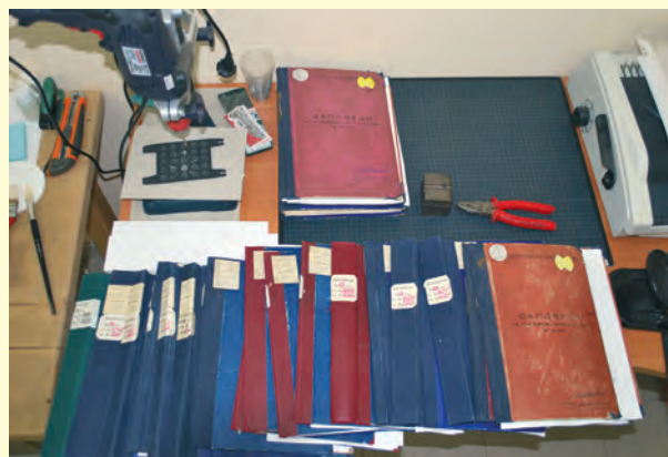
Обработване и реставрация на документи в сектор ДРЗА Processing and restoration of documents at DRSA sector