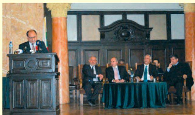
Международна научна конференция „Евреите в Източна Европа и Съветският съюз по време на Втората световна война и Студената война (1939-1989)“, ноември 2012 г. International scientific conference 'Jews in Eastern Europe and the Soviet Union during World War II and the Cold War (1939-1989)' November 2012