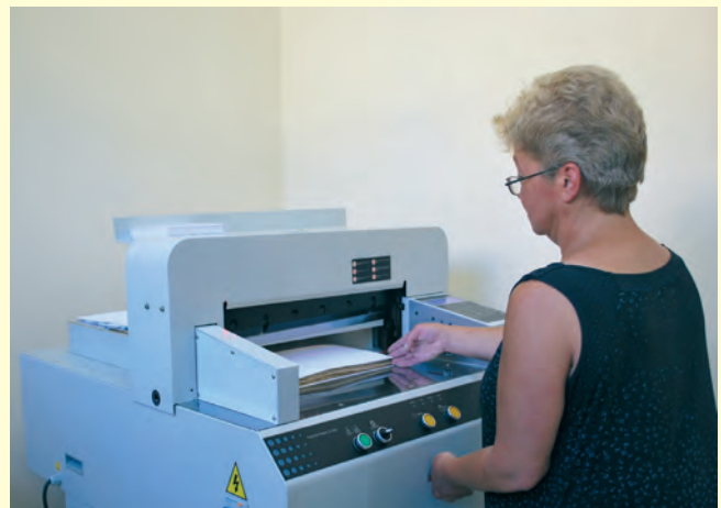
Лабораторията за реставрация на документи The laboratory for restoration of documents