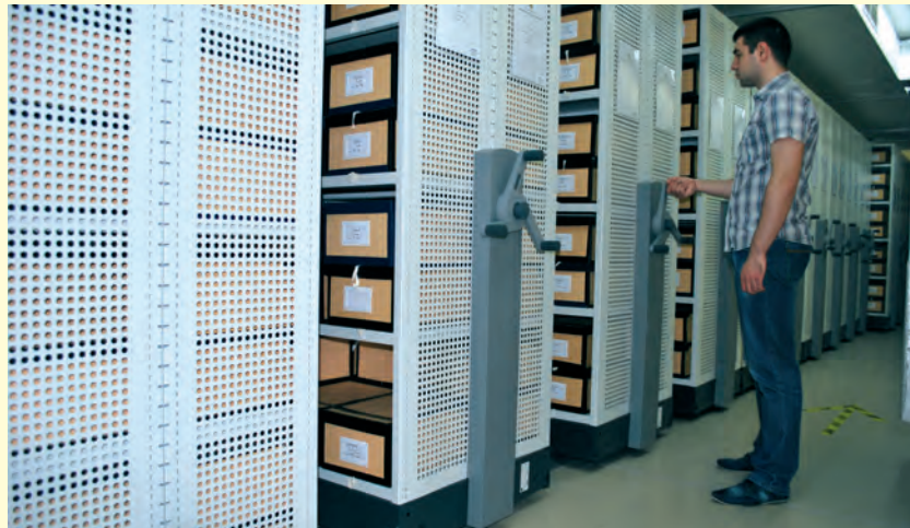
Съхранение на документи Preservation of documents