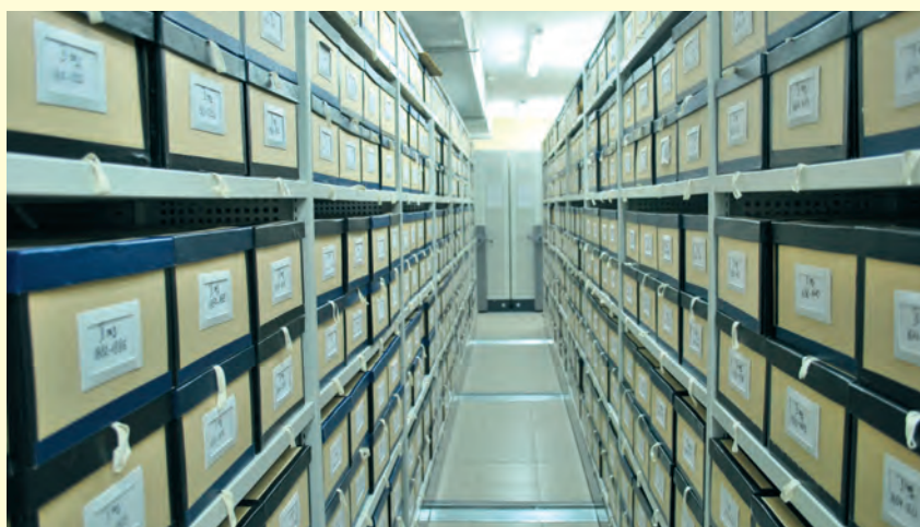
Модерните стелажни системи за съхранение на архивните документи The modern shelving system for preservation of archival documents

Въз основа разпоредбите на закона архивните документи се приемат от органите по чл. 1 от закона и постъпват в дирекция „Архив“, включваща отдел „Специализиран архив и картотека“ (САК) и отдел „Комплектуване, съхранение дигитализация, реставрация и застраховане на архива“ (КСДРЗА).