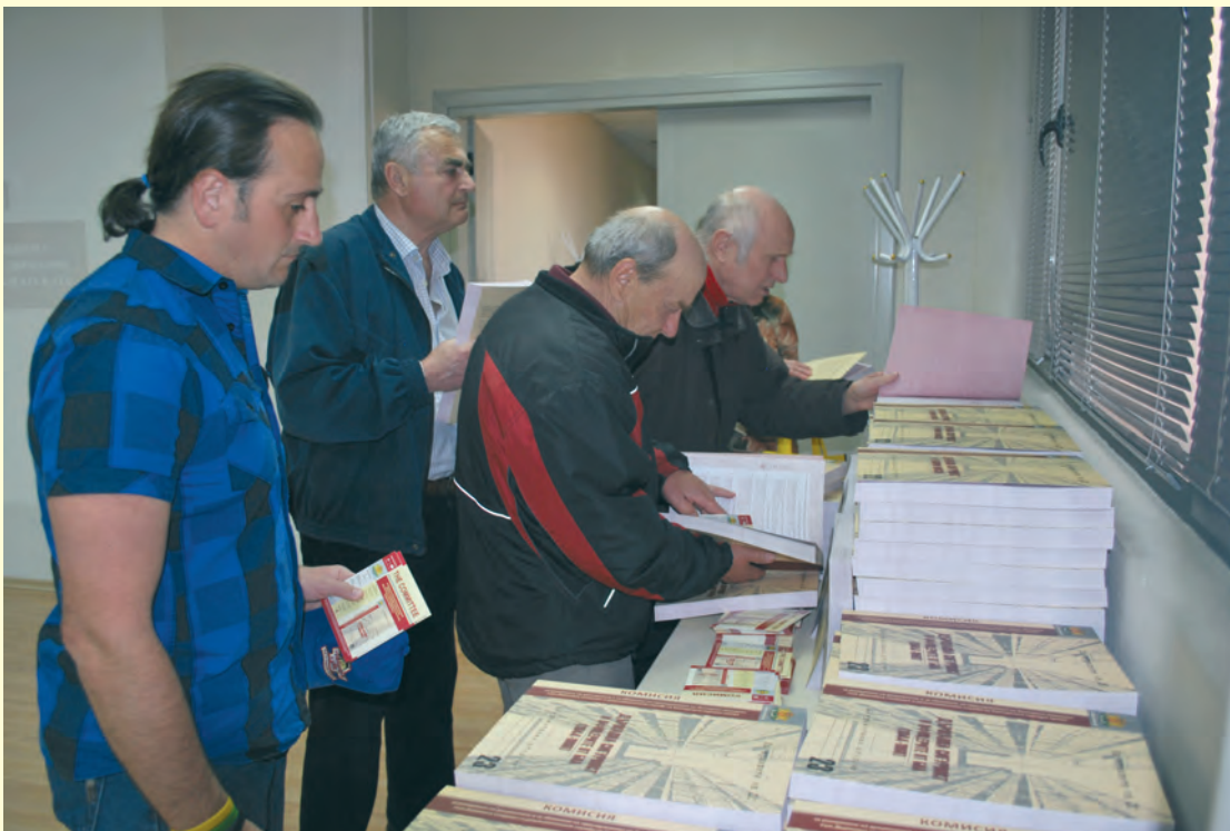
Представяне на документалните сборници „Държавна сигурност и гранични войски“ и „Държавна сигурност и офицерите от БНА (1944–1960)“ в Регионалния исторически музей - Стара Загора

Presentation of the documentary collections ‘State Security and border troops’ and ‘State Security and BNA officers (1944–1960)’ at the Regional Historical Museum–Stara Zagora