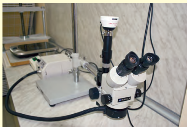
Комисията разполага с най-съвременната техника за реставрация на архивни документи The Committee has the most modern equipment for restoration of archival documents