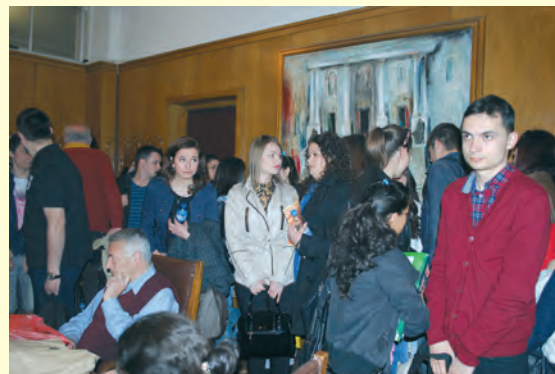
Студенти на представянето на документалния сборник „ДС и спортът“ Students during the presentation of the documentary collection ‘State Security and sports’