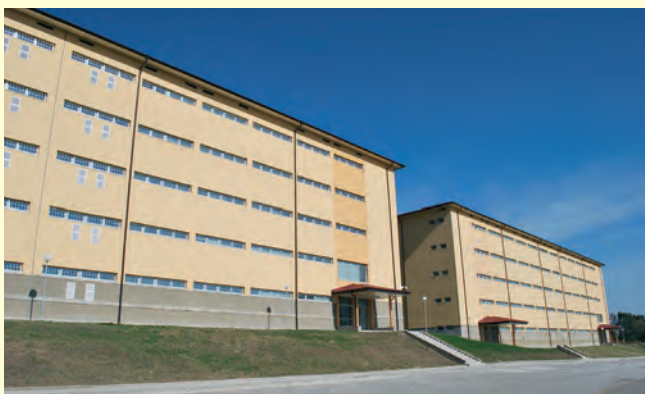
Сградите на Централизирания архив днес The buildings of the Centralized archives today

Преодолявайки редица трудности, свързани с осигуряването на сграден фонд, и след проведен мащабен ремонт, на 8 февруари 2011 година официално бе открит Централизираният архив на Комисията в Баня.