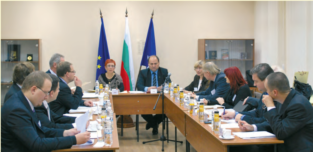
Председателско заседание на Европейската мрежа за съхранение на архивите в България с участие на ръководителите на 7-те партньорски организации, ноември 2011 г. Chairmen's meeting of the European Network of Official Authorities in Charge of the Secret Police Files in Bulgaria, with the participation of the heads of the 7 partnering organizations in November 2011

Конференцията „Международният тероризъм в документите на комунистическите тайни служби“ по време на българското председателство на ЕМСА, ноември 2011 г.