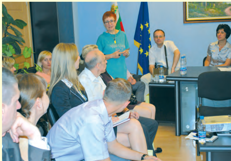
Украинска делегация на среща с членове на Комисията, юли 2012 г. Ukrainian delegation, at a meeting with the Committee members, July 2012