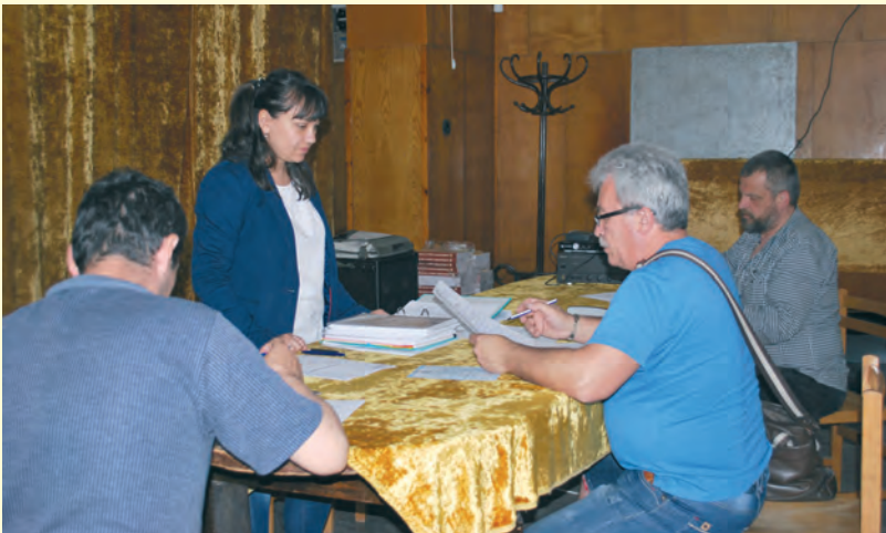
Комисията гостува в Кюстендил и в Стара Загора с временни приемни за граждани

The Committee visits Kyustendil and Stara Zagora with temporary receiving rooms for citizens