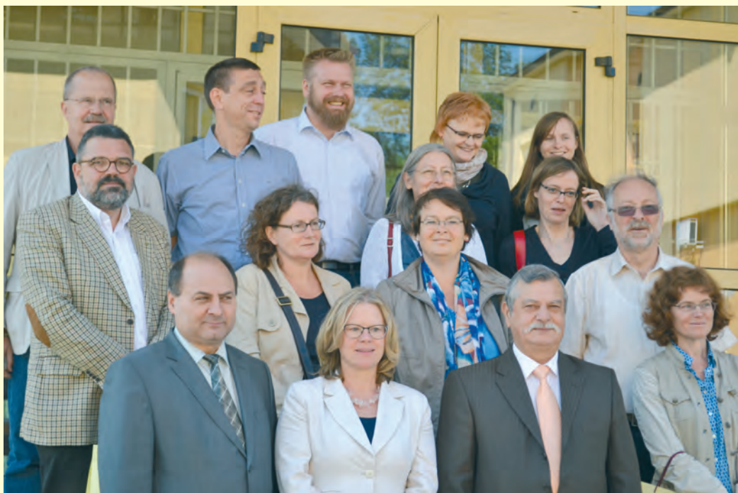
Представители на Германската федерална фондация за преоценка диктатурата на ГЕСП на посещение в Централизирания архив на Комисията в Баня, юни 2013 г. Representatives of the German Federal Foundation for the reevaluation of the dictatorship of the Socialist Unity Party in Germany visiting the centralized archive of the Committee in Bankya, June 2013

Следвайки своите цели, свързани с международното сътрудничество, Комисията редовно се включва в инициативи, провеждани в Европейския парламент, свързани с прочита на историята на комунистическото минало. В рам-