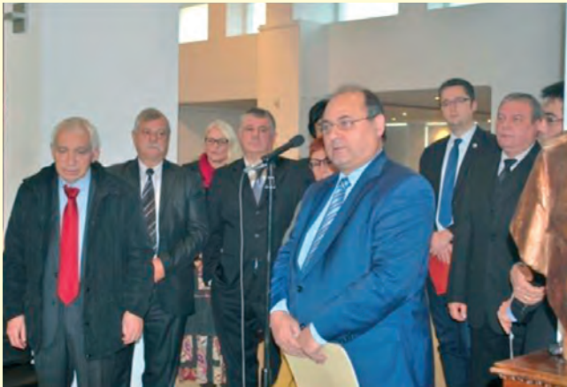
Откриване на изложбата „Десталинизацията – дилемата на едно противоречиво десетилетие (1953-1964)“, октомври 2014 г. Opening of the exhibition 'Decentralization – the dilemma of a controversial decade (1953-1964)', October 2014