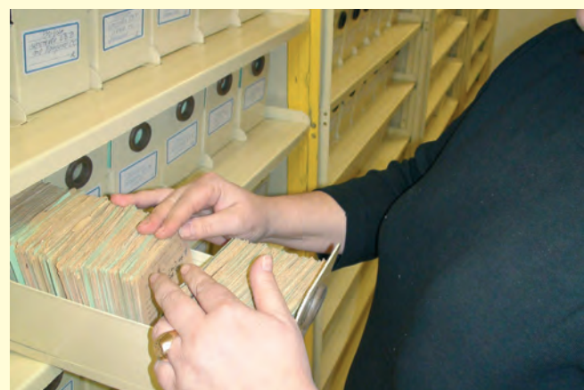
Специализиран архив и картотеки Specialized archives and card-indexes

При изпълнение на оперативните си задачи служителите от администрацията се ръководят от пространно разписани вътрешни правила.