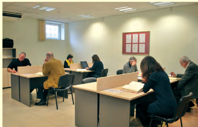
Обновената читалня на Комисията The renewed reading room of the Committee

До 1 май 2015 година читалнята на Комисията е посетена от 14 500 лица. Заявления за проверка са подали общо 18 700 лица.