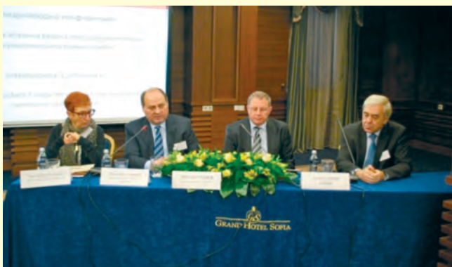
Международна конференция на тема: „Преходът в Източна Европа през документите на комунистическите тайни служби“, София, 2013 г. International conference on: 'The transition period in Eastern Europe in the documents of the communist Secret Services', Sofia 2013