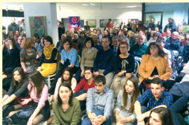
Залата на Българския културен център в Берлин се оказва тясна при представянето на документалния филм за Комисията „Досието на ДС“, февруари 2015 г. The hall of the Bulgarian cultural centre in Berlin appeared to be narrow at the presentation of the Committee's documentary 'The dossiers of SS', February 2015.