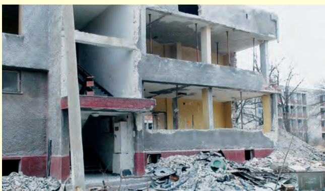
Това, което заварихме What we found at the beginning

Комисията изпълни изискването по закон и създаде Централизиран архив на документите на ДС и РС на БНА. Приемането на документи и попълването на архива започна от първия ден на нейната работа. Междувременно бе изграден модерен комплекс в град Баня. Двата големи корпуса, в които се помещават архивите, са оборудвани с най-съвременните стелажни системи, а документите се съхраняват при режим, който отговаря на най-високотехнологичните изисквания относно грижата към запазване на оригиналите.