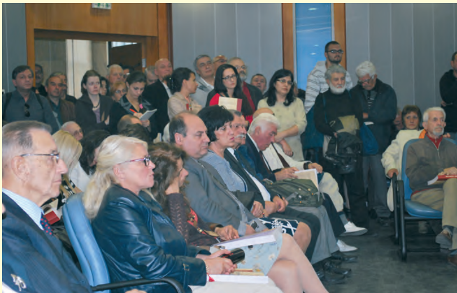
Представяне на документалния сборник „Държавна сигурност и „вражеските“ радиостанции“ в СУ „Св. Климент Охридски“ Presentation of the documentary collection 'State Security and the 'enemy' radio transmitters in Sofia University 'St. Kliment Ohridski'