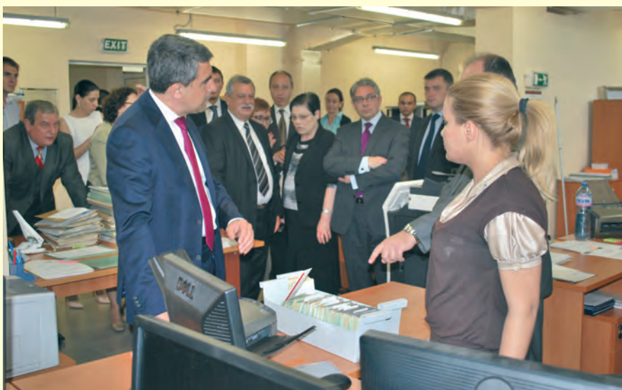
Президентът на Република България Росен Плевнелиев на официално посещение в Централизирания архив в Банкя, юни 2014 г. The President of the Republic of Bulgaria Rosen Plevneliev on official visit to the Centralized archive in Bankya, June 2014

Relying on up-to-date technologies, twenty-two depositories provide accommodation to the documentary heritage of the past. Descriptive inventory of all documents is available. Each deposit of records is placed within the overall arrangement and classification scheme to reflect its origin and the principle of provenance. Housed in a build-up area of 2,364.01 square meters and a total floor area of 10,926.04 square meters, the Centralized archives have its own laboratory for disinfection, restoration and preservation of documents.