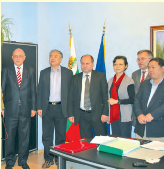
Посещение на китайска делегация, 2010 г. Visit of the Chinese delegation, 2010