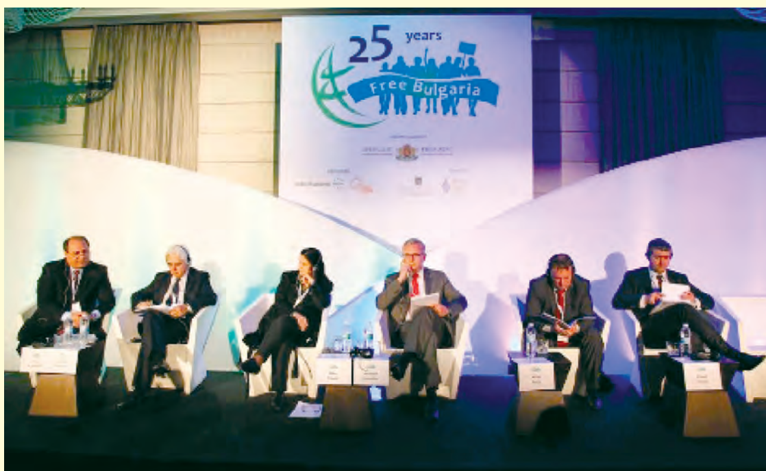
Международна конференция „Как да се справим с миналото, гледайки в бъдещето“, ноември 2014 г. International conference 'How to deal with the past looking to the future' November 2014