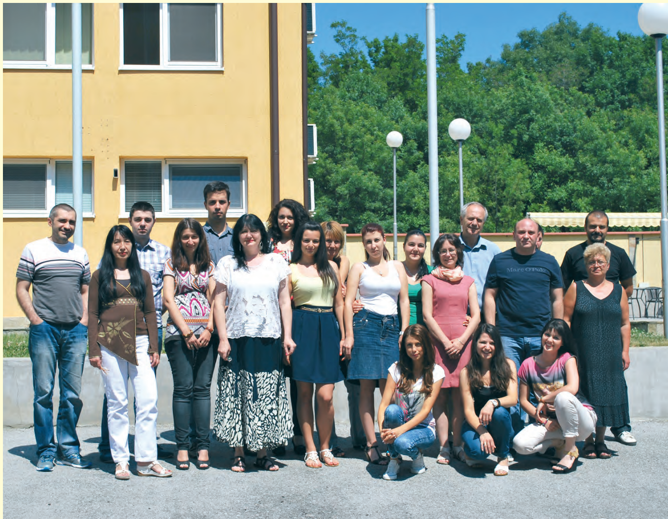
Служители от Централизирания архив Employees of the Centralized archive

К омисията е изградила администрация, която е разделена на дирекции, отдели и сектори. Общата ѝ численост е 103-ма души. Екипът е преобладаващо млад и много амбициран. При изпълнението на задачите си служителите комплектуват и съхраняват архивните документи на тайните служби от близкото минало на България, осигуряват достъп до тях на граждани и изследователи и се стремят все по-пълно да информират обществото за тяхното съдържание посредством издателската и публичната си дейност.