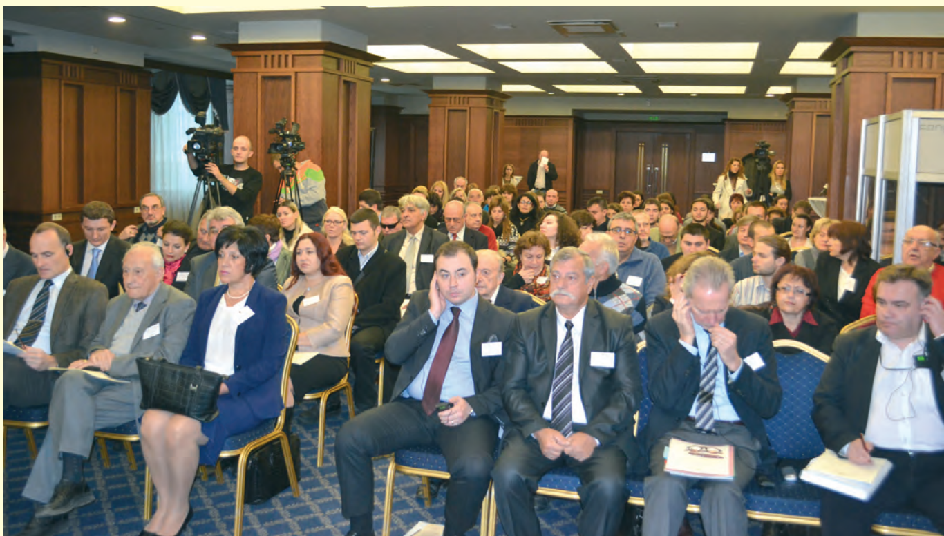
Конференция „Преходът в Източна Европа през документите на комунистическите тайни служби“, София, 2013 г. Conference 'The transition period in Eastern Europe through the documents of the communist Secret Services', Sofia 2013