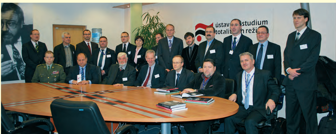
Председателски съвет на EMCA, Прага, 2013 г. Presidents meeting of European Network of Official Authorities in Charge of the Secret Police Files, Prague 2013